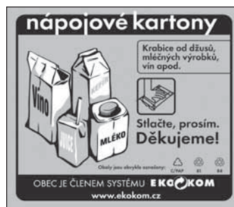
Samolepka – nápojové kartony

Běžně používané nálepky na kontejnery pro odkládání plastových komunálních odpadů a odpadních nápojových kartonů: